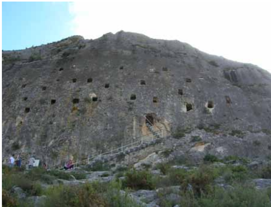
Covetes dels Moros

Restaurante El Cancell, ble vi servert en meget vel-smakende middag. Imøtekommende og profesjonell service satte ekstra spiss på oppholdet i dette hotellet.