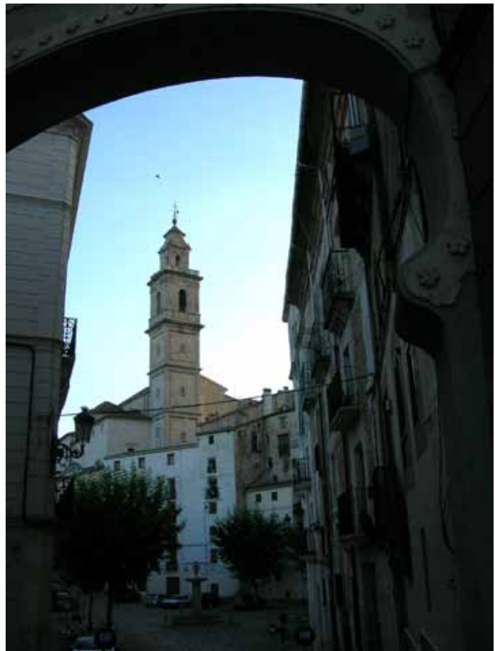
Inngangen til gamlebyen

Bocairent ligger bare ca 12 minutters kjøring fra Agres, og vi hadde bestilt overnatting med middag på Hotel L’Agora midt i gamlebyen. Været var på vår side denne torsdagen tidlig i oktober, så vi kunne nyte en velfortjent kald øl i solvarmen på terrassen. Men det var etter at vi hadde beundret det spennende hotellet med sine helt spesielle østeninspirerte rom. Kvalitet og god smak tvers igjennom! På hotellets spisested,