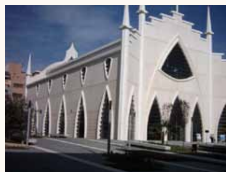
Kirken i Torrevieja