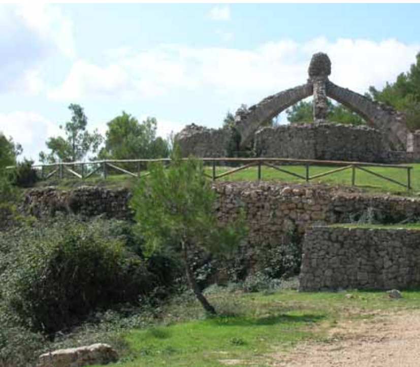
La Gran Cava i Sierra de Mariola

Men det vanker også en ekstra bonus: Vi er snart fremme ved en av Valencias aller best bevarte isbrønner – La Gran Cava eller Cava Arquejada.